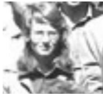
Official photograph of the meeting on Endomycorrhizas held in Leeds, UK, 1974.